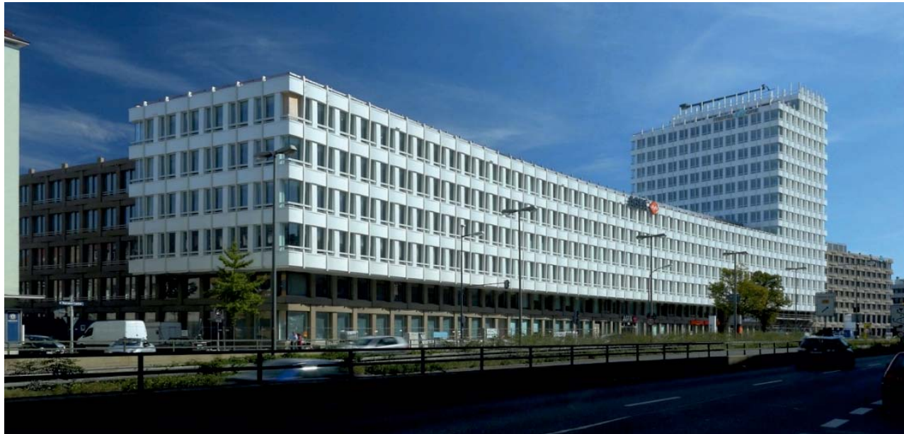
oben: Giesinger Hochhaus an der Tegernseer Landstraße unten: Verkehrsprognosen 2015